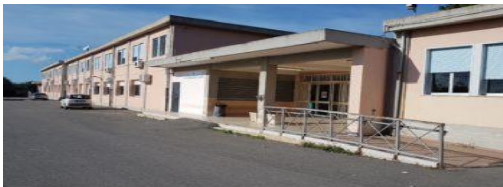
Sede associata - Istituto Professionale Statale per L’Agricoltura “F. Leonti”

Il nostro Istituto, sede associata dell’I.I.S. “Enzo Ferrari” di Barcellona P.G., è ubicato in contrada Margi, dista circa 5 chilometri dal centro urbano. L’edificio, a due elevazioni fuori terra, si trova in buono stato di conservazione ed è circondato da un grande cortile alberato. Al piano terra si trovano i locali della Direzione e della Segreteria didattica, dotati di attrezzature informatiche.