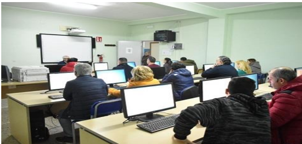
Laboratorio di Informatica