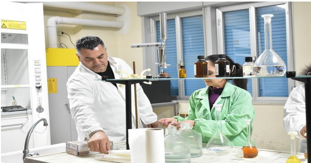
Laboratorio di Chimica

L'Azienda Agraria è provvista anche di circa 3 ettari di terreno, con frutteto, piante di agrumi e di olivo, tutti in irriguo.